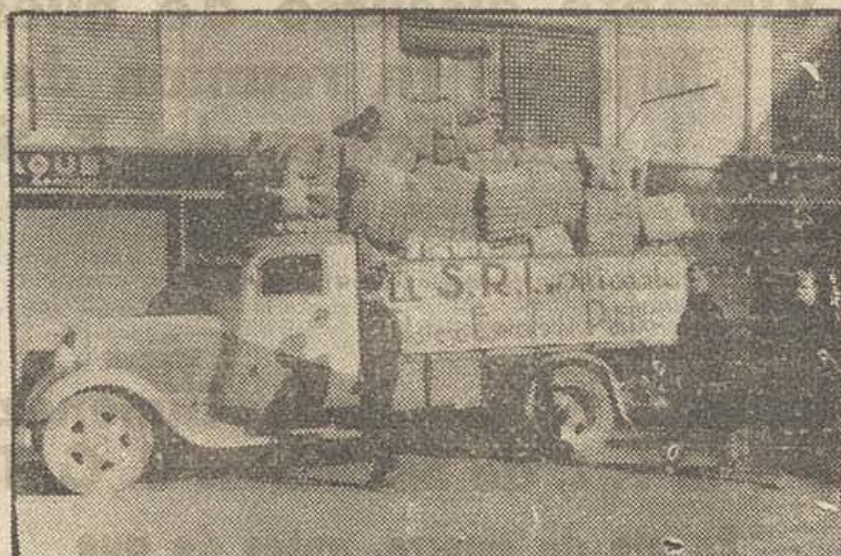
Camión del Socorro Rojo de Alicante, que lleva mantas y ropas a los soldados del Ejército del Este.