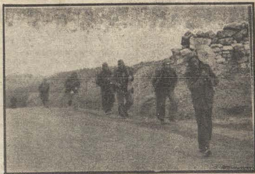
¡CADA METRO DE TIERRA, UNA TRINCHERA!

Un grupo de soldados marcha a fortificar. ¡Combatientes! Tenéis tres armas fundamentales: el fusil, el pico y la pala. Combatid y fortificad. ¡Cada montón de piedras ha de convertirse en un parapeto! ¡Cada metro de tierra, en una trinchera!