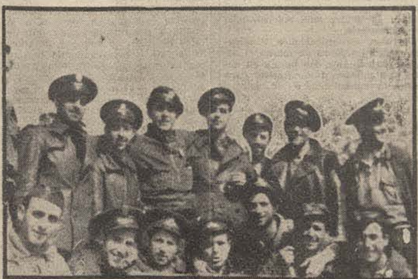
Guardias de Asalto que hicieron un heroico salvamento de material, y de los cuales se hablaba en nuestra crónica de ayer.

Elogió las decisiones de las dos sindicales obreras para realizar una acción conjunta, y pidió a los jóvenes que engrosen las filas de las divisiones de voluntarios, organizadas por los jóvenes de la J.S.U.—Febus.