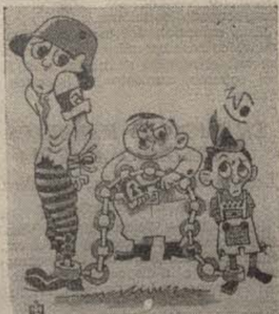
EL ANSCHLUSS... SEGUNDA VUELTA