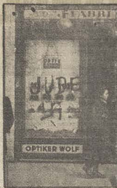
Esta foto ha sido tomada en Viena, a pesar de la rigurosa censura nazi, y pasada de contrabando al extranjero. Ella dará una ligera idea del terror nazi en Austria, contra los judíos. Véase la palabra «jude» (judío), y la cruz gamada en el escaparate de una tienda de óptica.

Su salida ha dado lugar a que se produjera un tumulto, a causa de los gritos provocativos dados por los elementos de tendencias nazis, a cuyos gritos, los senadores de la mayoría han contestado: «¡Que se vayan! ¡Nos hacen ninguna falta!», etc. — Fabra.