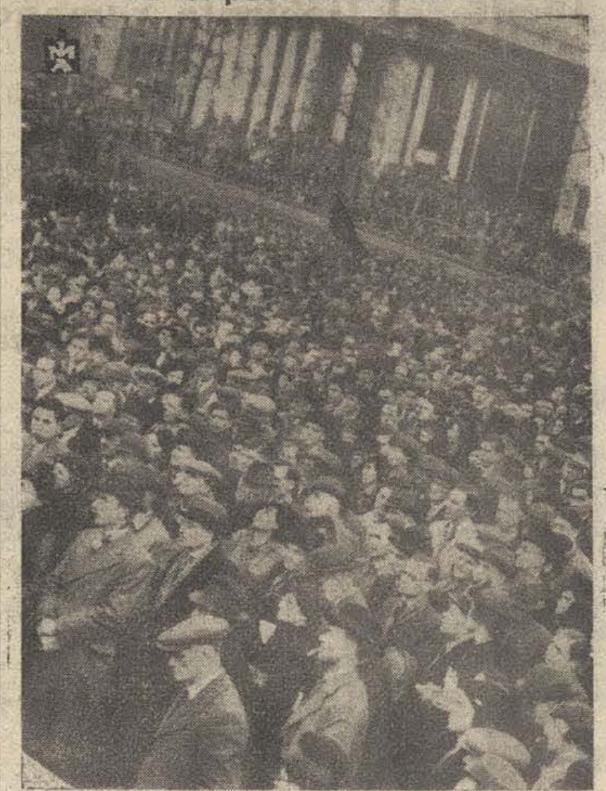
LONDRES. — Más de 20.000 personas se manifestaron en Trafalgar Square contra la ocupación de Austria por las tropas alemanas.