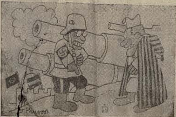
—¡Alto el fuego! Tenemos que oír el discurso del Führer.

Por otra parte, se denuncia la actitud de ciertos industriales encargados de la construcción de material de guerra, los cuales aplican la semana de 36 horas para disminuir la producción. — Ag. España.