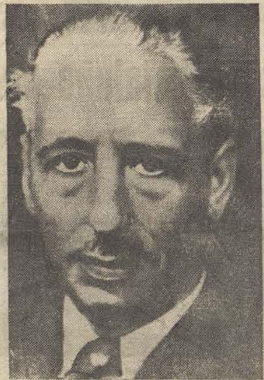
EL PRESIDENTE DE CATALUÑA, LLUÍS COMPANYS

«Pueblo de Cataluña: Os hablo en unos momentos en que más que nunca busco, dentro de la deficiencia de mis aptitudes y condiciones, los recursos humanos para que me acerquen a poder ser digno de la virtud histórica y responsabilidad inmensa como presidente de Cataluña y de mi propia obligación como catalán y como hombre. Os hablo en unos momentos en los que busco y no encuentro la palabra que pueda traducir la intensidad y complejidad de los estímulos y vibraciones de mi ser. Os habla Lluís Companys, presidente de Cataluña.