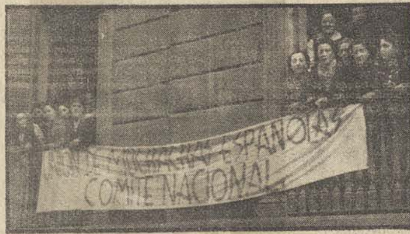
«Unión de Muchachas» desarrolla estos días una gran actividad. Del local de las muchachas españolas salen grupos de compañeras que, con las muchachas de la «Alianza de la Dona Jove», recorren calles, pueblos, fábricas y talleres.

La U. G. T. está orgullosa de una juventud y ve con simpatía la organización de las dos divisiones de voluntarios. Nuestros Sindicatos y secciones ayudarán al trabajo de la J. S. U. En una obra como esa, de tan eficaz contribución a nuestra lucha, los esfuerzos de todos deben consistir en que los propósitos sean realidad en el plazo más breve.»