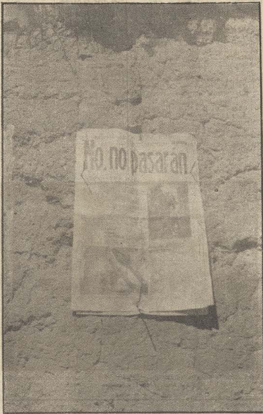
«Frente Rojo» en las trincheras. El «No pasarán» de nuestro pueblo, de todos los combatientes, clavado en los campos de la resistencia

pendientes municipales del Consejo Municipal de Madrid, sin distinción de ideologías políticas, para examinar los momentos actuales en relación con la lucha sangrienta que España sostiene