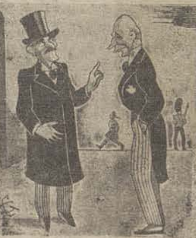
CHAMBERLAIN.—Estáte preparado, Halifax. Es posible que el día menos pensado se te llame a Berchtesgaden.

Las grandes palabras de Lenin: «Cada cocinera debe aprender a dirigir el Estado» han llegado a ser en la práctica de cada día, un fenómeno común, la suerte de millones de mujeres en la Unión Soviética.