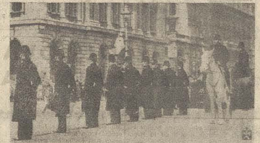
LONDRES. — Millares de personas se manifestaron ante la Embajada del Reich contra la nueva agresión hispanica.