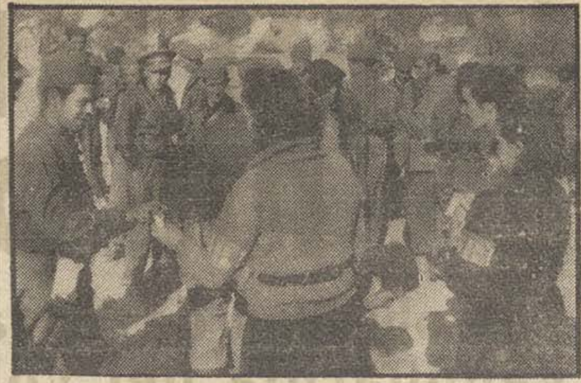
El S. R. L. de Alicante envía víveres para los soldados del Este. Reparto, en el frente, de los regalos enviados por el S. R. L. de Alicante

El domicilio oficial de esta dirección provisional será en Madrid.—Febus.