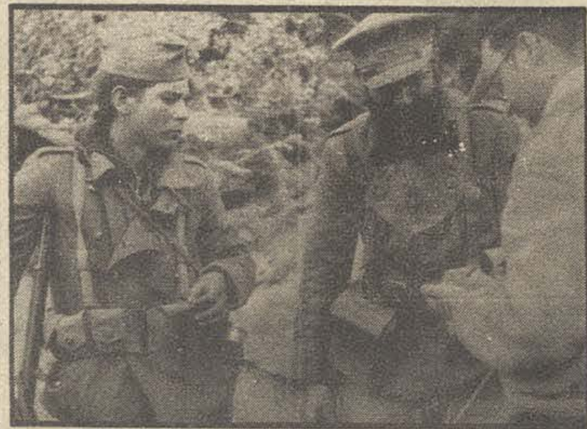
Los soldados del batallón «Thaelmann», de 17 y 42 años, que hicieron retroceder a los tanques en la carretera de Alcoñiz

En las puertas de nuestro territorio luchan encarnizadamente nuestros soldados. Todo el mundo clavado en su puesto. Cada hombre un gigante y cada catalán un hombre. Un hijo de Cataluña significa un heroico luchador