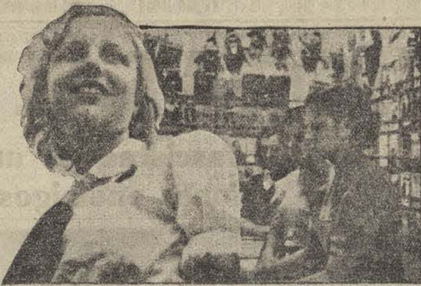
«A pesar de la guerra, nosotras, las muchachas que vivimos en la España Republicana, estamos contentas, porque vemos claro nuestro porvenir...»