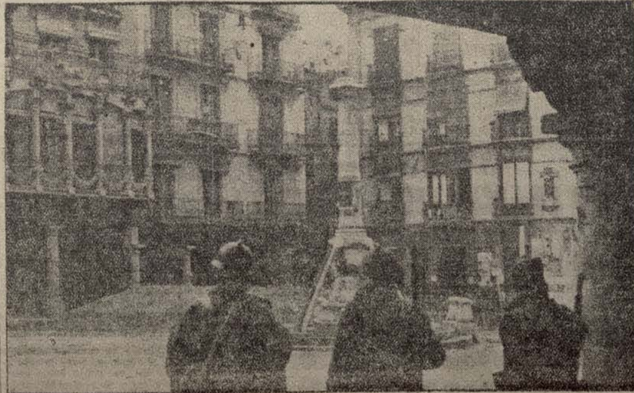
KRENKEL. — La Plaza del Turiso

Nuestro viaje a la deriva toca a su fin. En abril o mayo probablemente tendremos bajo nuestros pies el sólido puente del rompimiento. En estos días, Moscú ha hecho saber que se están elaborando diversos métodos para sacarlos del banco de hielo. Ya hemos en-