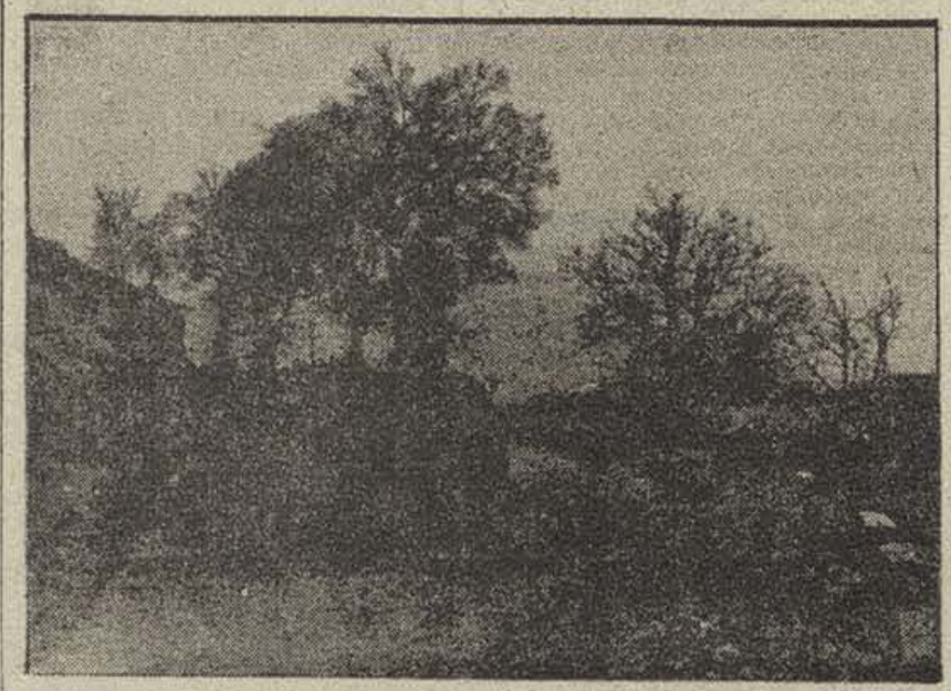
El «Parapeto de la Muerte» poco después de ser brillantemente asaltado

cal ha sido ya liquidada por el Congreso de Toulouse de 1936. La unidad sindical ya es un hecho; también tiene que serlo la unidad política. «Duclos recordó luego las insistentes proposiciones de unidad formuladas por el Comité Ejecutivo de la Internacional Comunista y por el Partido Comunista francés y como en 1932 respondiendo al llamamiento lanzado por Henry Barbuse y Romain Roland en el Congreso antifascista y pacifista de Amsterdam el Partido Comunista se adhirió inmediatamente al movimiento iniciado en dicho congreso, negando» en cambio a ello el Partido Socialista, que procedió «no sólo a la expulsión de los militantes socialistas que en él habían participado». Duclos siguió enumerando los esfuerzos realizados por el Partido Comunista para lograr la unidad de acción, la cual se pudo por fin crear realizada, con la firma, el 27 de julio de 1934, del Pacto de unidad de acción por los Partidos Comunista y Socialista. Más ahora, tomando como pretexto el artículo de Dimitroff la C. A. P. «Ejecutiva-socialista decide interrumpir las conversaciones entabladas con vistas a la unidad orgánica: «Todos sabemos — declara Duclos — que en el Partido Socialista existen adversarios decididos de la unidad; pero todos sabemos también que en su inmensa mayoría los camaradas