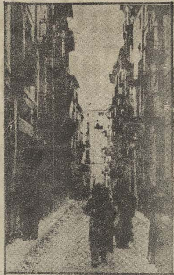
Teruel reconquistado: La calle de los Amantes

Pero el gran Ejército de nuestro pueblo no eleva el caudal de sus cualidades, en el orden moral y táctico, en la pasividad de las trincheras. La iniciativa recuperada por la República después de semanas de paz con la operación de Teruel, irradia a otros frentes donde nuestras armas manifiestan su movilidad en acciones parciales. En el Este las tropas leales arrebatan al enemigo posiciones importantes, quedando en nuestras manos magníficas líneas de