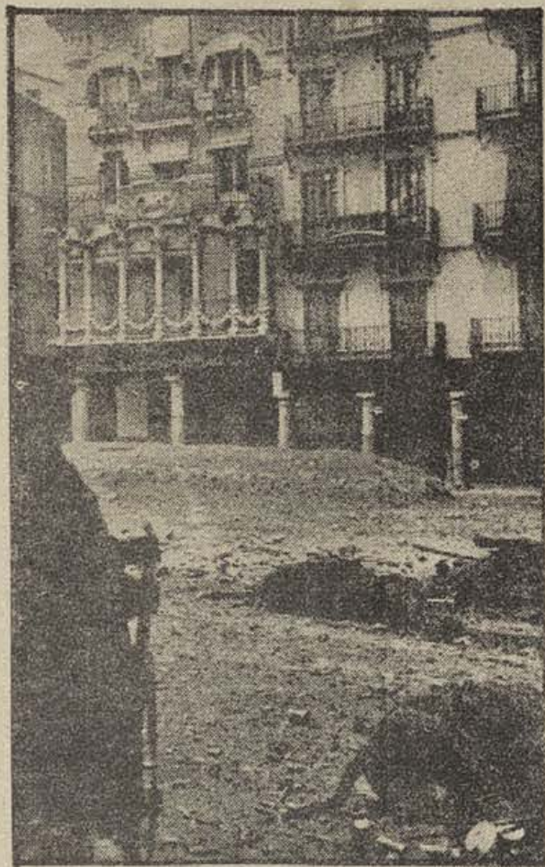
TERUEL. — La Plaza del Torico, después del combate