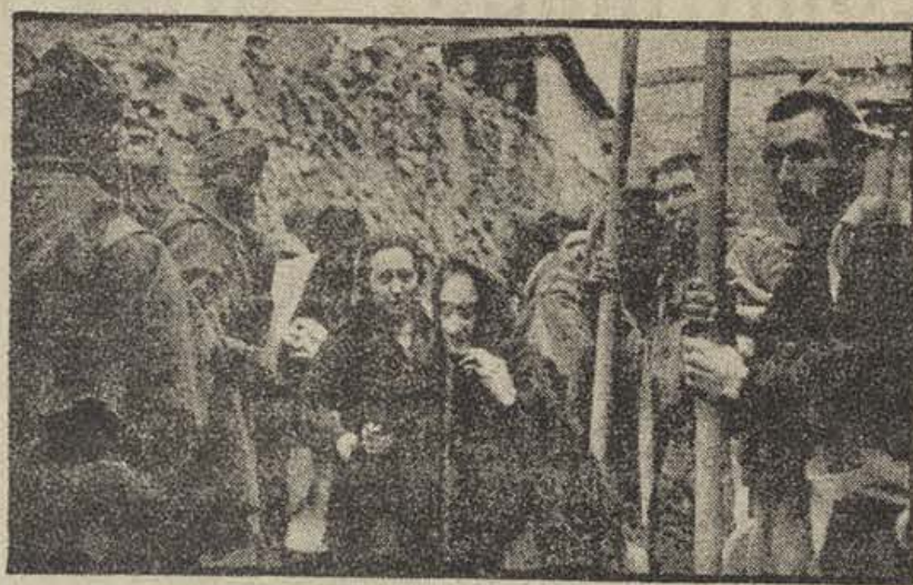
Mujeres del pueblo liberadas en Teruel

Las dudas que en este orden se susciten deben consultarse a este Comité de Enlace a través de la dirección del Partido a que los interesados pertenecan. — Febus.