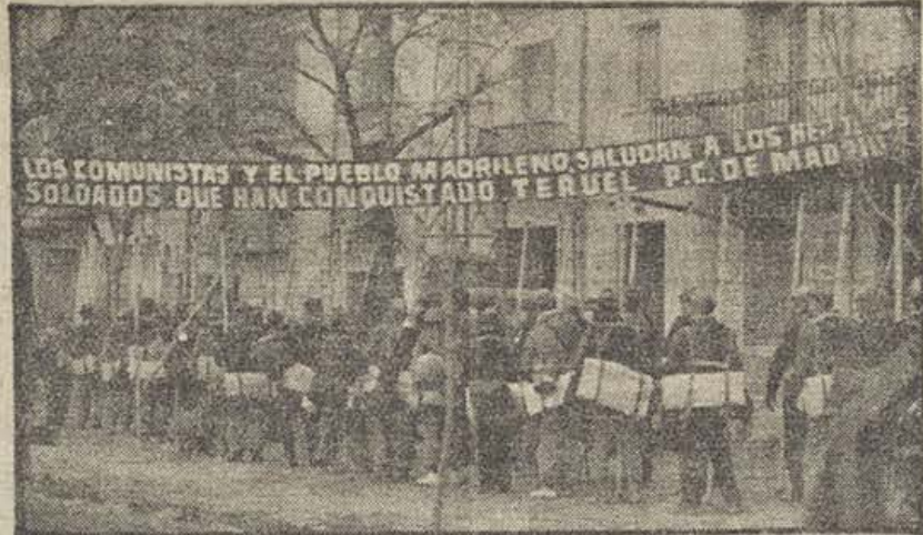
Soldados que entran en la ciudad. Ante ellos un gran cartel que dice: «Los comunistas y el pueblo madrileño saludan a los soldados que han conquistado Teruel. P. O. de Madrid»

Finalmente, fué preguntado el camarada Hernández sobre si se había tratado en el consejo del decreto sobre reorganización de periódicos y de papel para los mismos, y ha dicho que este problema había quedado aplazado para el próximo consejo.