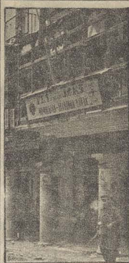
TERUEL. — El cuartel de Falange (Foto Mayo)