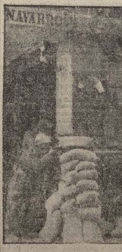
Lucha en las salidas de Teruel

INFANTILES Martínenc 5 — Badalona 1. Sans 7 — Júpiter 2. Barcelona 1 — Español 3. Aveno 2 — Europa 0.