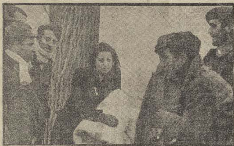
TERUEL. — Los soldados de la victoria charlan con la población civil de la ciudad liberada