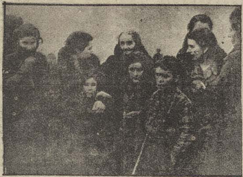
Niños y mujeres que sufrieron año y medio de opresión fascista en Teruel