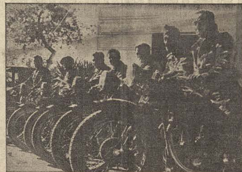
Motoristas. Sus veloces máquinas son armas de guerra