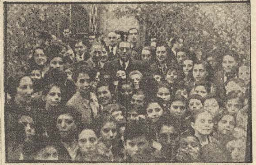
Parte del público que asistió al acto de solidaridad.

Las compañeras francesas saludaron después, en compañía del señor Companys y del camarada Comorera, a un grupo de niños, recibiendo sus muestras de afecto en un acto de emocionada sencillez.